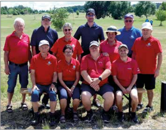
Swinggolfer vor dem Heimspiel in Horbach

LANGENZENN - Der Auftakt am 14.05.22 in Renningen und am 15.05.22 in Markdorf verlief für die Horbacher noch recht gut mit insgesamt 587 Schlägen und